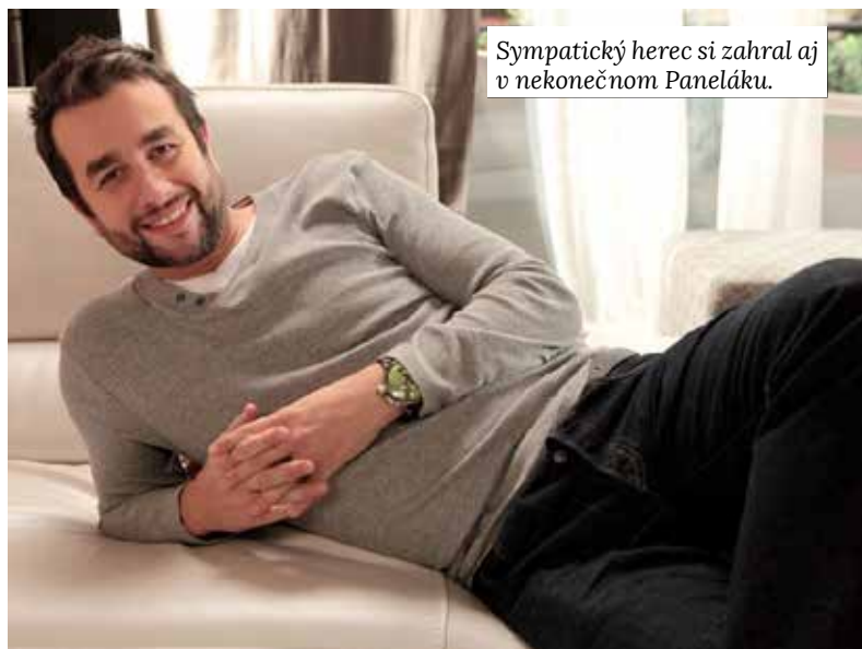
Sympatický herec si zahral aj v nekonečnom Paneláku.

■ Môj otec istý čas pracoval v Čiernej nad Tisou, tak sme bývali aj tam. Na